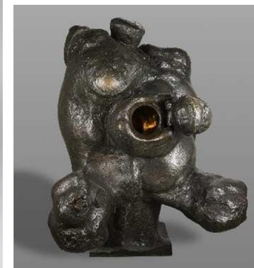
Eva madre tierra , bronce, 1967. 🔗