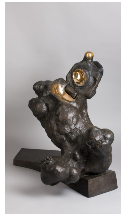
Hombre caído con puerta , bronce, 1966-67. 🔗

Son estas mismas ideas las que también pretende plasmar en su serie Unidad-Yunta comenzada a la vez que Hombres con puerta . Ambas las mostrará en una serie de exposiciones internacionales como Sculptures from twenty nations en 1967 que, organizada por el Museo Guggenheim de Nueva York, itinerará por América. En esta exposición el músico y productor Terry Philips sintió un flechazo por los Hombres con puerta , a raíz del cual The Hobbits les dedicó la canción “Men and Doors”, inspirada en textos de Serrano, y colocó un Hombre con puerta como imagen del LP.