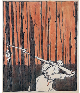
Ramón Acín Escenas alusivas a la Primera Guerra Mundial , 1919 Lápiz sobre papel

original y gran emotividad expresionista que quiere subrayar la humanidad perdida.