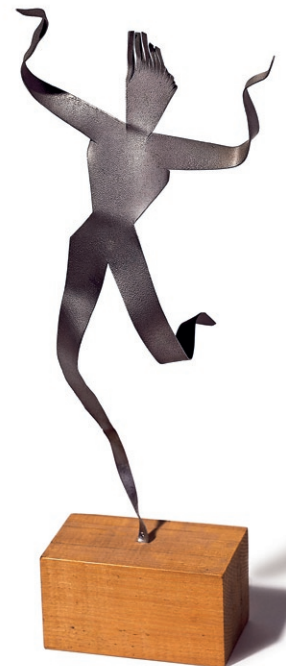
Ramón Acín Bailarina , 1928 Chapa de aluminio

cuidada depuración formal, su arte se «desterritorializa» para confundirse con la vida y reflejar la esencia, el «sol de la Belleza», la Luz.