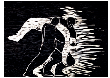
Katia Acín Dos cargan al muerto , ca. 1999 Xilografía

El dolor individual de esta víctima pasa a convertirse en formulación plástica de toda la violencia de la pasada centuria. Cuando el espectador sienta una honda compasión humana, la artista habrá conseguido su objetivo.