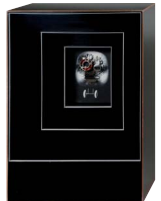
Sin título , c. 1963 Técnica mixta sobre tela 204x173,3 cm