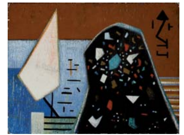
Sin título, c.1953 Técnica mixta sobre arpillera 139x197 cm