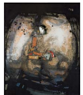
Sin título, 1957 Técnica mixta sobre arpillera 132,5x84 cm